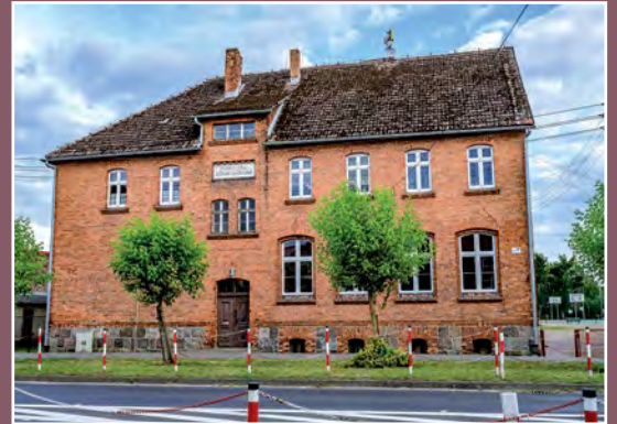
Szkoła w Drawsku Schule in Drawsko