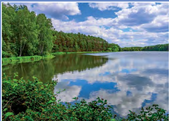
Stawy gospodarstwa Kwiejce - Karpniki Teiche des Fischereibetriebes Kwiejce - Karpniki