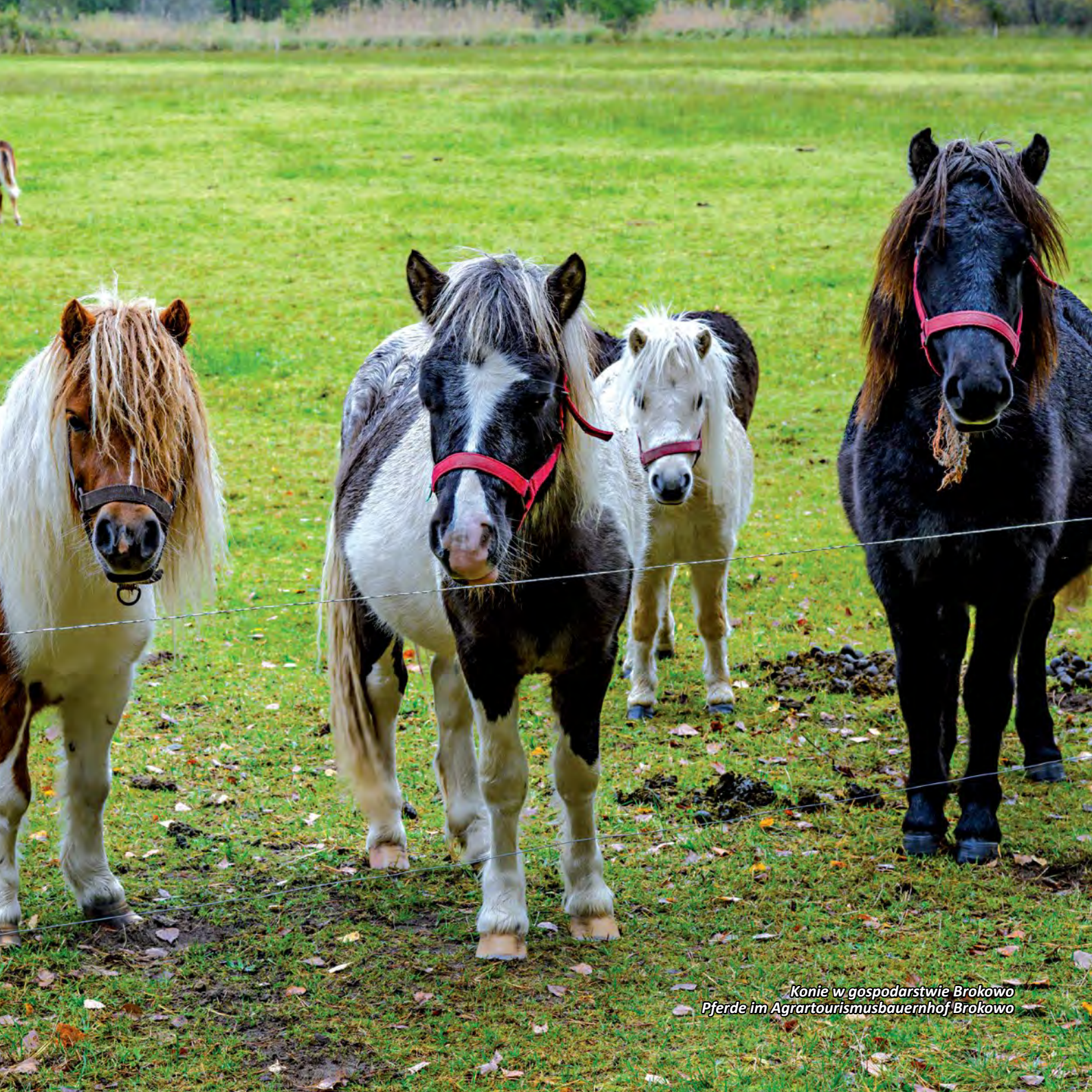
Konie w gospodarstwie Brokowo Pferde im Agrartourismusbauernhof Brokowo