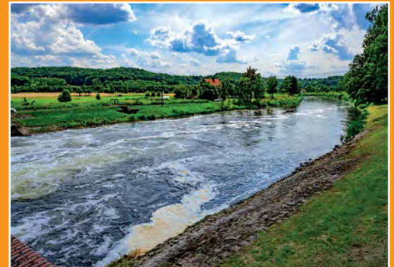
Notek w Pianówce Netze in Pianówka