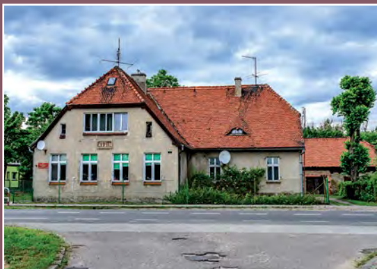
Szkoła w Drawskim Młynie Schule in Drawski Młyn