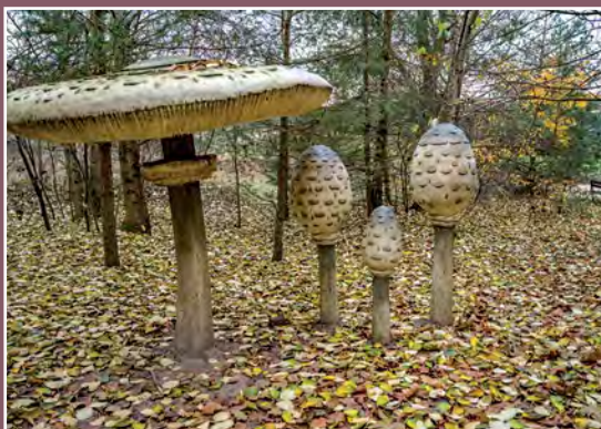
Park grzybów leśnych w Piłce Pilzpark in Piłka