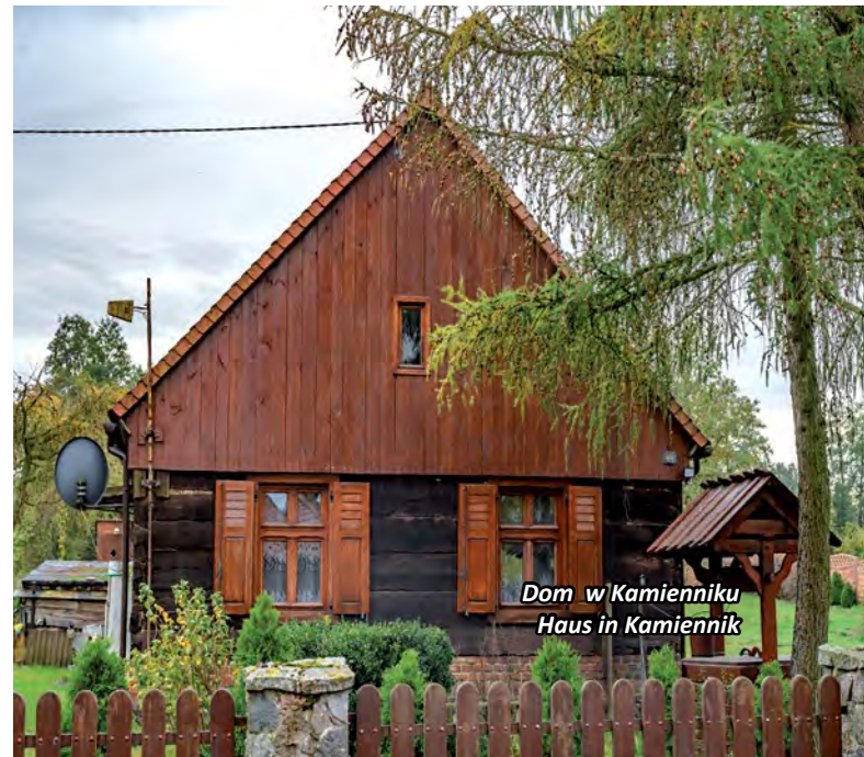
Dom w Kamienniku Haus in Kamiennik

Różny jest układ przestrzenny wsi na terenie gminy: Drawsko, Chełst i Kwiejce mają układ zbliżony do ulicówek, Piłka to wielodrożnica. Do ciekawszych obiektów architektury murowanej z drugiej połowy XIX wieku i początków XX wieku należy budynek, w którym mieści się aktualnie Urząd Gminy Drawsko, pierwotnie będący siedzibą właściciela dóbr ziemskich i tartaku oraz dawne i aktualne budynki szkolne w Drawsku, Drawskim Młynie, Chełście, Kamienniku, Piłce, Pęcownie oraz dawny kościół ewangelicki wraz z pastorówką w Piłce.