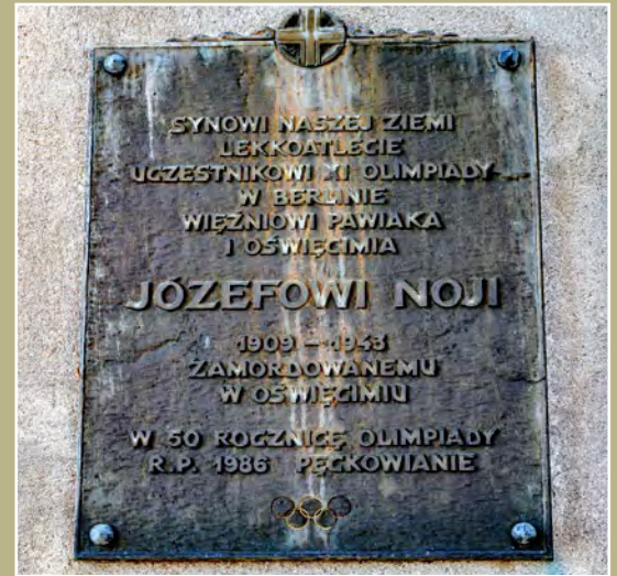
Tablica pamiątkowa Józefa Noji w Pęcckowie Gedenktafel an Józef Noji in Pęcckowo

Leszcza posolić, posypać pieprzem, odstawić na 2 godziny w chłodne miejsce. Folię aluminiową wysmarować grubo masłem, włożyć rybę i zawinąć, wstawić na 20 minut do piekarnika. Wyjąć, ostudzić, zdjąć folię, wyłożyć na żaroodporny półmisek, wstawić na 5 minut do piekarnika. Posypać posiekaną natką pietruszki. Położyć kilka kawałków świeżego masła. Podawać z frytkami, surówką z cykorii lub zielonej sałaty z oliwą.