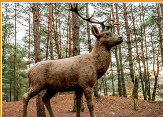
Park Grzybów Leśnych Piłzpark

bliskość lasów Puszczy Noteckiej i jezior, spokój, cisza, ciekawie przygotowane ekspozycje wzdłuż ścieżki parku są atrakcyjnym sposobem na terenowe lekcje biologii dla szkół i przedszkoli, a także zachętą do edukacyjnych wycieczek i spacerów dla rodzin z dziećmi.