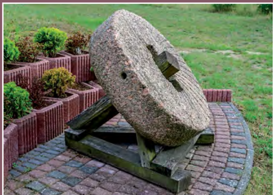
Kamień młyński w Drawskim Młynie Mühlenstein in Drawski Młyn