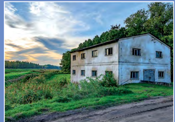
Stawy Zawada Teiche in Zawada