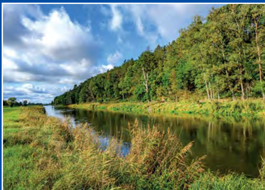
Noteć koło Moczydła Netze bei Moczydla

Noteć, płynąca ze wschodu na zachód stanowi naturalną granicę gminy od północy, wzdłuż meandrującej rzeki zlokalizowane są pola uprawne i pastwiska. Noteć to rzeka o ustroju śnieżno-deszczowym, której maksimum przypada wiosną (przez topnienie śniegów) i latem (wskutek opadów atmosferycznych).