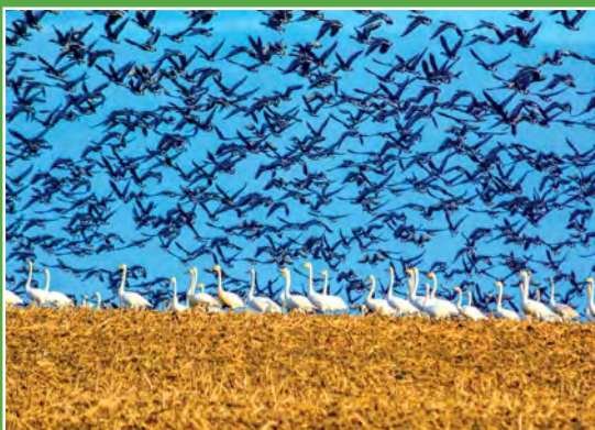
Jesienne wędrówki ptaków Herbstliche Migration der Vögel

szy w Polsce obszar wydm śródlądowych, o przeważającej wysokości 20-30 m, a maksymalnie sięgającej 98 m n. p. m. Wydmy porasta w 92% las sosnowy. Pozostałości drzewostanów naturalnych są objęte ochroną w rezerwach przyrody (rezerwat Cegliniac) Na jego obszarze znajduje się ponad 50 jezior, pochodzenia wytopiskowego, z grubą warstwą mułu i zakwitami glonów. W zagłębieniach terenu lub na brzegach jezior utrzymują się torfowiska.