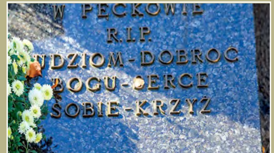
Nagrobek proboszcza z Pęcckowa Grabstein des Pfarrers aus Pęcckowo