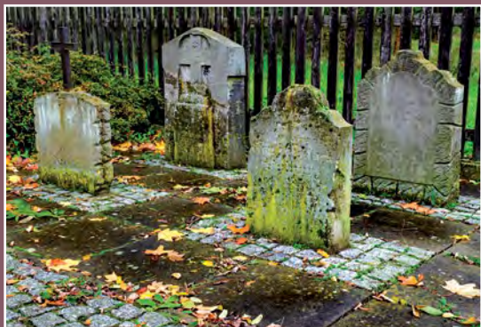
Cmentarz ewangelicki w Kwiejcach Starych Der ehemalige evangelische Friedhof in Kwiejce Stare