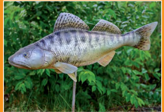
Maryliński Świat Ryb Fische Welt in Marylin

Turystyczna atrakcja znajdująca się nad jeziorem Moczydło w Marylinie, przy drodze wojewódzkiej nr 135 biegnącej przez Puszcze Notecką. Teren jest ogólnodostępny, całoroczny. Atrakcyjność krajobrazu,