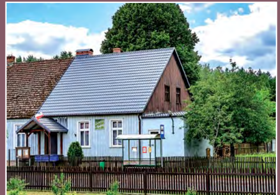
Świątlica wiejska w Kwiejcach Starych Gemeinschaftshaus in Kwiejce Stare