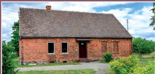
Dawna szkoła w Kawczynie Ehemalige Schule in Kawczyn