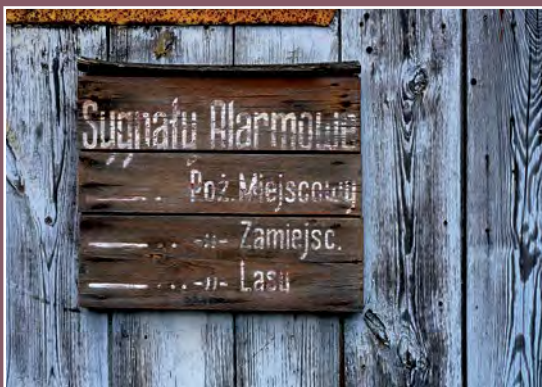
Remiza w Kwiejcach Nowych Ehemalige Feuerwache in Kwiejce Nowe