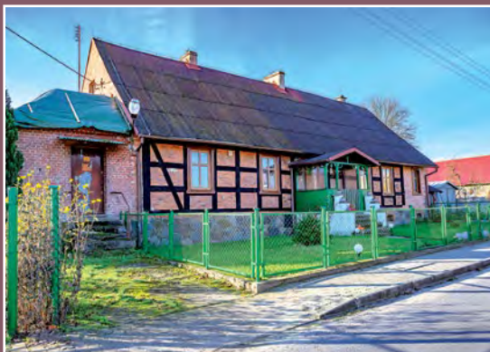
Stary dom w Chełście Altes Haus in Chełst