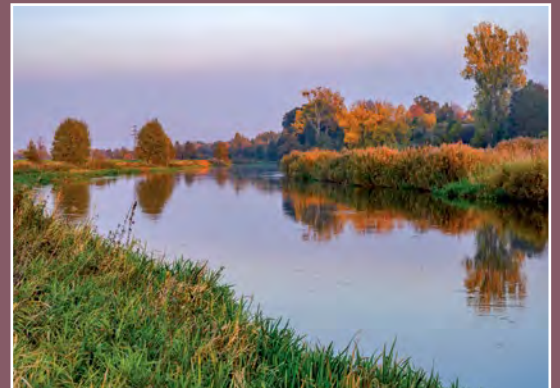
Noteć koło Drawska Netze bei Drawsko