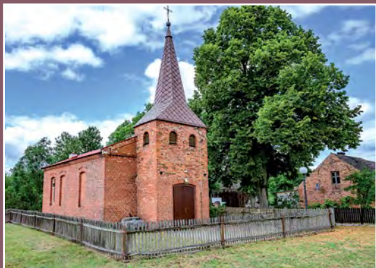
Dawny kościół katolicki w Chełście Alte katholische Kirche in Chełst