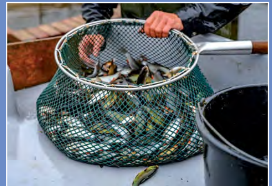
Odłow rybn na terenie NGR Fischfang auf dem Gebiet der Netzer Fischer Gruppe (NGR)