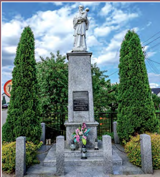
Figura świętego Stanisława Kostki Figur des heiligen Stanislaw Kostka in Pęckowo

W 1595 r. Piotr Czarnkowski sprzedał Chrystianowi margrabiemu brandenburskiemu dobra wieleńskie za 25 000 złotych !