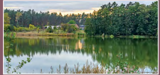
Leśna osada Borzysko Młyn Waldsiedlung Borzysko Młyn

W XV w. na Noteci istniał jaz należący do Drawska służący do połowu ryb. W latach 1564/65 wzmianka o mieszkańcach Drawska, którzy łowią ryby w Noteci i po połowie ze wsią Bielice w Drawie. Do wsi Drawsko należały młyny: Drawski Młyn i Zawada na strudze Hamrzysko. Pola i łąki Drawska graniczyły z Marchią Brandenburską; jedna z łąk używana była przemiennie – w jednym roku kosili ją miesz-