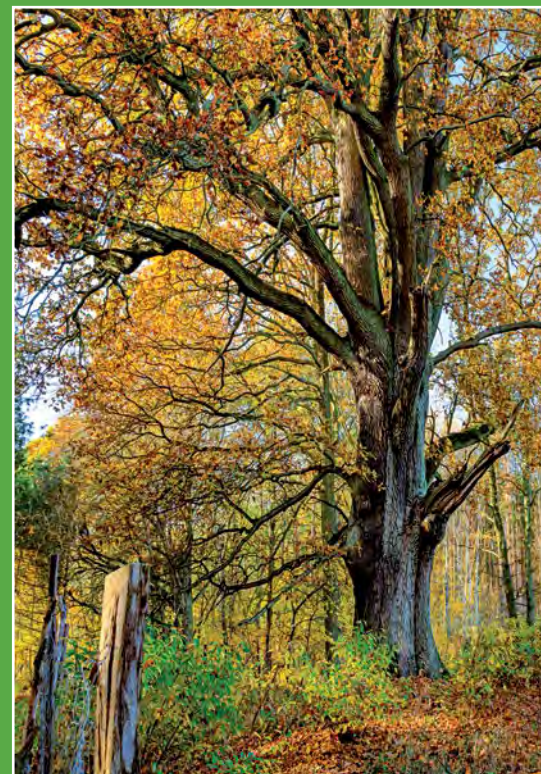
Pomnikowy dąb „Patriarcha” Majestätische Eiche „Patriarcha“