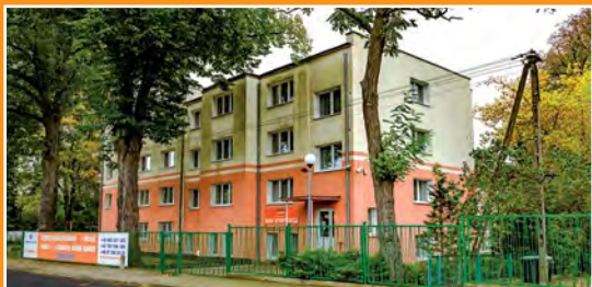
Dom Sportowca w Kwiejcach Starych Haus des Sportlers in Kwiejce Stare