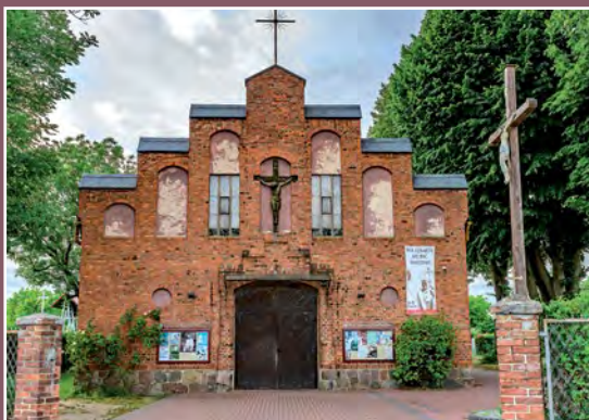
Kościół w Drawsku Kirche in Drawsko