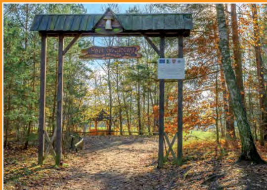
Park Grzybów Leśnych Piłzpark