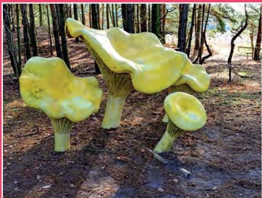
Park Grzybów Leśnych w Piłce Pilzpark in Piłka