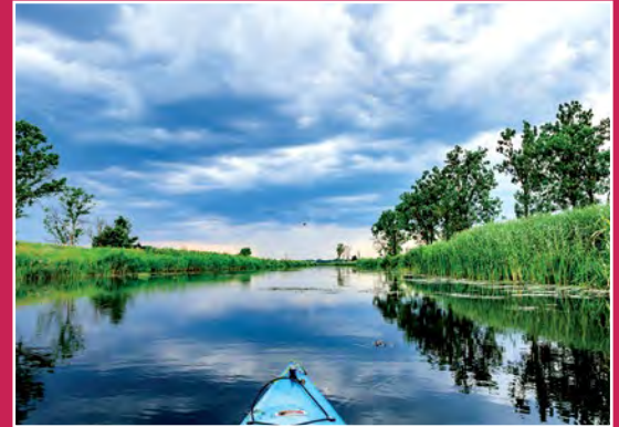
Kajakiem po Noteci Mit dem Kajak auf der Netze

Rybę oprawić. Ostrożnie solić ze względu na sól zwarta w kapuście. Kapustę wypłukać, aby nie była zbyt kwaśna lub słona. Słoninę pokrajana w kostki zeszklić, dodać posiekana cebule, trochę smalcu, paprykę pokrajana w talarki, wsypać szybko paprykę mieloną, zamieszać i natychmiast dodać kapustę, popieprzyć i dusić na małym ogniu ok. godziny. ze smalcu i maki przyrządzić zasmażkę i dodać do niej drobno posiekany koperek. Zaciągnąć tym duszona kapustę. Dodać do kapusty filety rybne i dusić pod przykryciem w piecyku ok. 20 min. Na koniec dodać śmietaną i raz zagotować. Podawać na półmisku, na który najpierw wyklada się kapustę, na nią filety. Polewa się to śmietaną i stopionym smalcem z papryką. Z reszty suma można zrobić galarety, zwykłym sposobem robienia rybnej galarety.