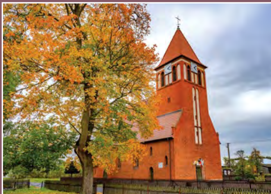
Kościół w Kwiejcach Starych Kirche in Kwiejce Stare