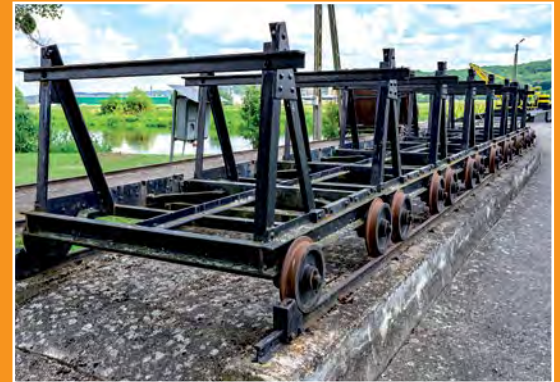
Na noteckiej śluzie An der Netzeschleuse

Ryby sprawić, oczyścić, opłukać, pokroić na dzwonka. W rondlu rozgrzać olej, wrzucić obraną, pokrojoną cebulę oraz obrany i zmiążdżony czosnek. Podsmażyc nie rumieniąc, dodać ryby i dusić 15 minut, mieszając drewnianą łyżką. Włoszczyznę obrać, umyć, rozdrobnić, zalać 2 litrami wody i ugotować wywar. Do garnka z rybami wlać wino, 2 litry wywaru z warzyw, dodać przyprawy korzenne, tymianek i gotować wszystko na małym ogniu 1 godzinę. Następnie zupę przecedzić, a ryby przetrzeć przez sito. Doprawić szafranem, solą i pieprzem. Podawać w filiżankach, z dodatkiem grzanek. Ser do posypania zupy podać w osobnym naczyniu. Jeżeli po wigilii zostanie jej trochę, można ją zaprawić śmietaną, posypać siekaną pietruszką i podać z łazankami lub drobnym makaronem.