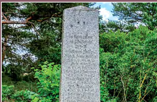
Pomnik poległych w Pełczy Gefallenendenkmal in Pełcza

zeum Okręgowe w Pile i przeniosło ją do Muzeum Kultury Ludowej w Osieku, tylko obora pozostała na miejscu