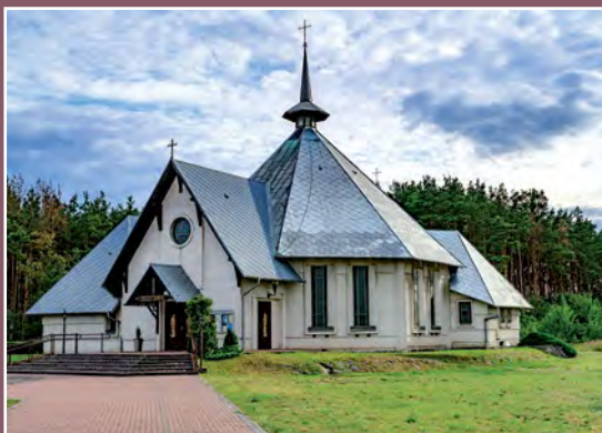
Kościół w Drawskim Młynie Kirche in Drawski Młyn