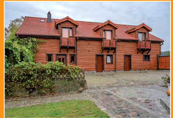
Rancho Bonanza Rancho Bonanza

Gospodarstwo posiada pokoje 2, 3 i 4 - osobowe oraz apartamenty. Do dyspozycji gości: jacuzzi, sauna fińska, sala bilardowa, basen, siłownia, kort tenisowy, kręgielnia, zadaszone miejsce przeznaczone do grillowania na świeżym powietrzu z drewnianymi, solidnymi siedziskami, salon, suszarnię dla grzybów oraz wędzarnię dla ryb. Do dyspozycji jest również łódka na jeziorze oraz rowery górskie. Na życzenie gości organizowane są spływy kajakowe i przejażdżka bryczką.