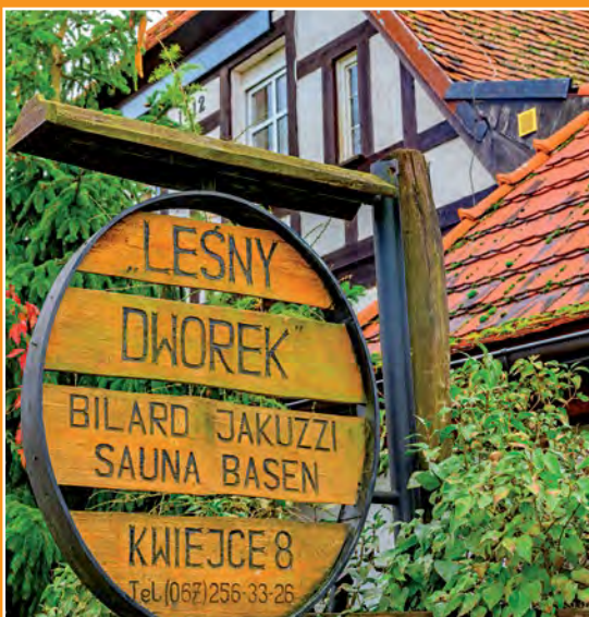
Gospodarstwo agroturystyczne Leśny Dworek Agrartourismusbauernhof Leśny Dworek