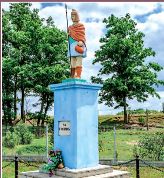
Figura św. Floriana w Kawczynie Figur des heiligen Florian in Kawczyn