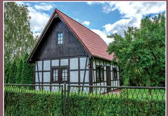
Stary dom w Kwiejcach Starych Altes Haus in Kwiejce Stare