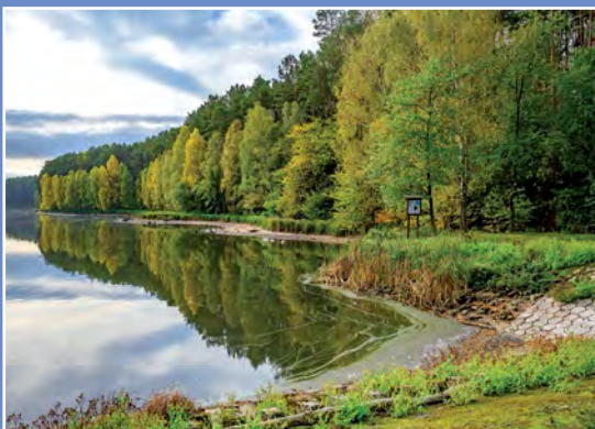
Stawy gospodarstwa Kwiejce - Karpniki Teiche des Fischereibetriebes Kwiejce - Karpniki

Na terenie NGR łącznie funkcjonuje około 50 podmiotów rybackich, w tym 43 to hodowcy stawowi, a 7 to użytkownicy jezior. Całkowita wartość produkcji to ponad 11,5 mln PLN.