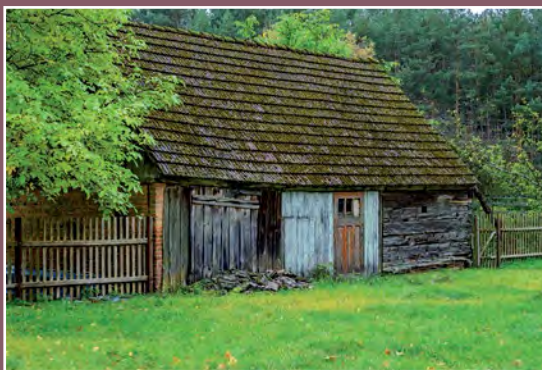
Stare budynki gospodarcze w Kwiejcach Starych Alte Wirtschaftsgebäuden in Kwiejce Stare