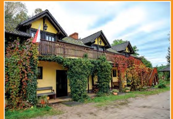
Gospodarstwo agroturystyczne Brokowo Agrartourismusbauernhof Brokowo