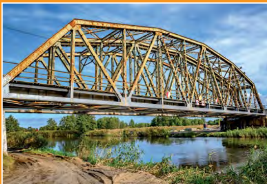
Most kolejowy na Noteci Eisenbahnbrücke auf der Netze