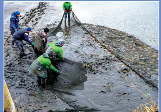
Odłow rybn na terenie NGR Fischfang auf dem Gebiet der Netzer Fischer Gruppe (NGR)