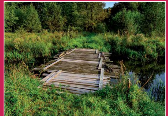
Kładka na szlaku turystycznym w Piłce Steg auf dem Wanderweg in Piłka