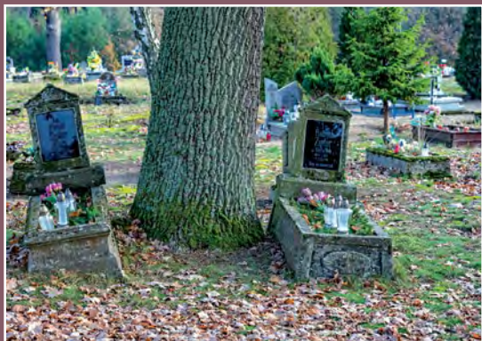
Cmentarz katolicki w Piłce Katholischer Friedhof in Piłka