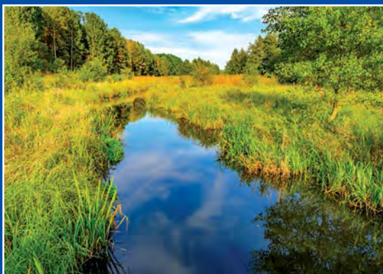
Miała w Piłce Miała – Flüß in Piłka