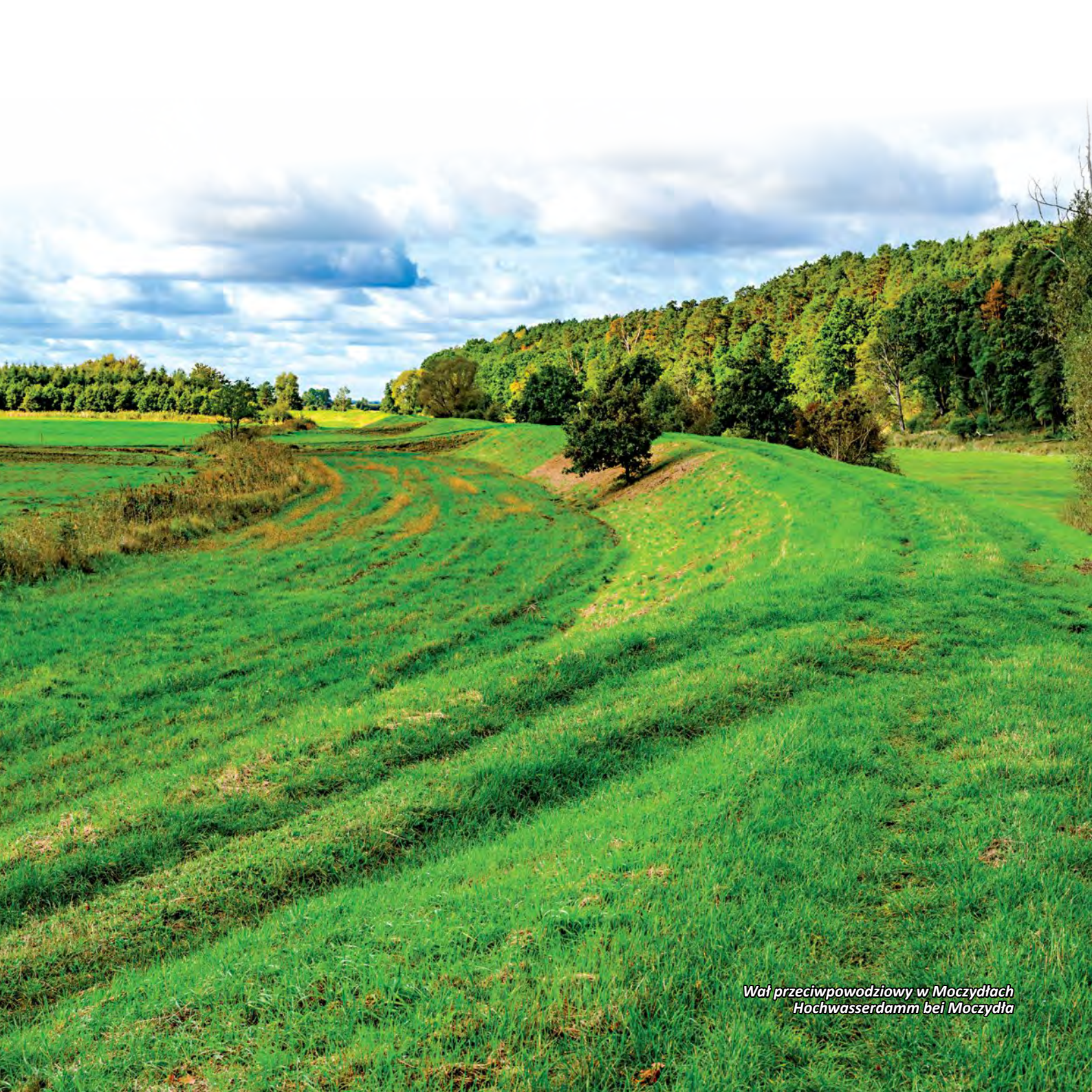
Wał przeciwpowodziowy w Moczydłach Hochwasserdamm bei Moczydła