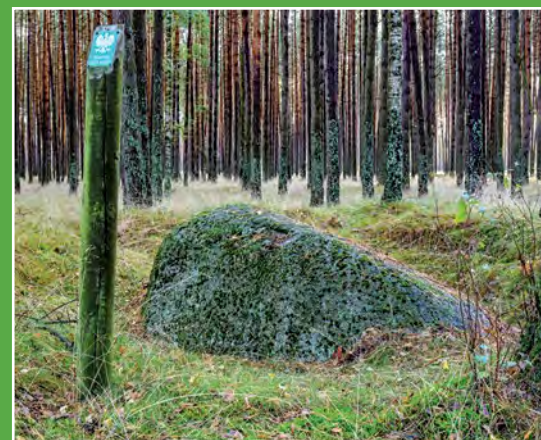
Pomnik przyrody głaz narzutowy koło Drawska Naturdenkmal – Findling bei Drawsko