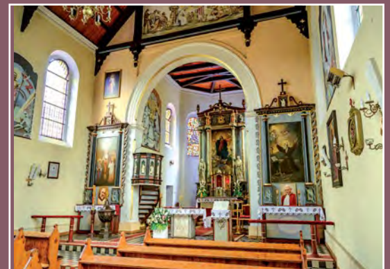
Wnętrze kościoła Das Innere der Kirche in Piłka