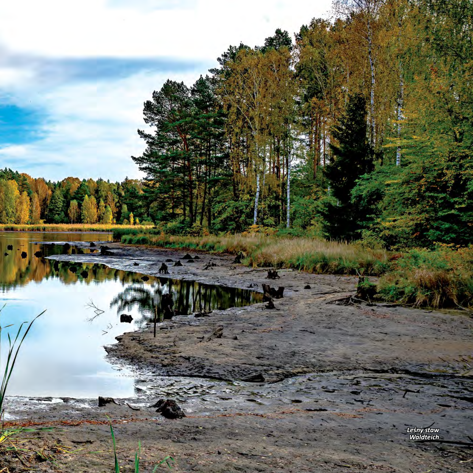
Leśny staw Waldteich