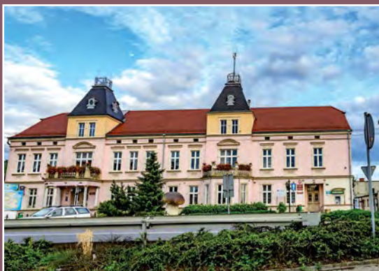
Dawny pałac w Drawsku – obecnie Urząd Gminy Alter Palast in Drawsko – heute Gemeindeamt

kańcy Drawska, w kolejnym poddani margrabiego brandenburskiego z Drezdenka. Do wsi Drawsko należały jeziora i stawy na południe od Noteci: Rakowiec, Rakówko, Brzuchacz, Simek, Kamieniec, Chelst (przy tym stawie biegła granica z Marchią). Na północ od Noteci należały do wsi m.in. jeziora Nieradz, Piaseczno, Głębozec, Pniewo.