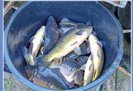
Odłow rybn na terenie NGR Fischfang auf dem Gebiet der Netzer Fischer Gruppe (NGR)

NGR wdraża LSR w ramach PO „Rybnactwo i Morze” na obszarze 7 gmin członkowskich, tj.: Drawsko, Krzyż Wlkp., Szydłowo, Trzcianka, Wieleń, Chodzież i Czarnków. Teren Gmin wchodzący w skład NGR to obszar, którego największym atutem turystycznym jest przyroda: lasy zajmujące połowę powierzchni, liczne jeziora i gęsta sieć rzek. Sieć szlaków do uprawiania różnego rodzaju wędrówek (pieszych, rowerowych, kajakowych, konnych) uzupełniana jest o elementy infrastruktury turystycznej, przybywa też miejsc noclegowych i placówek gastronomicznych. Liczne jeziora na tym terenie przyciągają wędkarzy, a rzeki o przebiegu górskim (Piława, Dobrzyca, Bukówka) dają też możliwość łowienia ryb łososiowatych. Tutejsze lasy słyną z bogactwa runa leśnego. Kajakarze korzystają z popularnych szlaków Gwdy oraz jej dopływów: Dobrzyca, Piława i Rurzyca, ale na wytrawnych wodniaków czekają też inne, trudniejsze rzeki: Bukówka, Krępicza, Łomnica, Człopica.