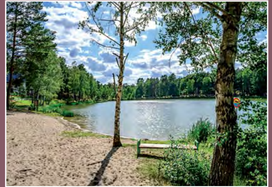
Jezioro Marylin Marylin See