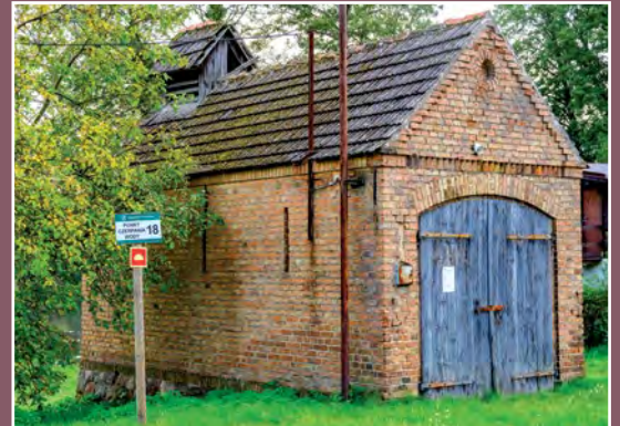
Dawna remiza Kamienniku Alte Feuerwache in Kamiennik