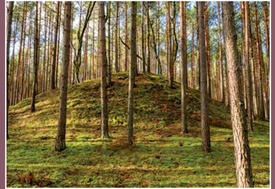
Kurhan koło Moczydeł Grabhügel bei Moczydła

W VIII w. nastąpił rozwój osadnictwa wczesnośredniowiecznego. Rozwój osadnictwa grodowego wpłynął na przemiany osadnictwa otwartego. Było to podstawą do kształtowania się wczesnoplemiennych, a później wczesnopiastowskich struktur osadniczych. W tym czasie kształtuje się obecny układ miejscowości, stanowiska średniowieczne i nowożytne występujące w pobliżu obecnych miejscowości wyznaczają tym samym ich metrykę.