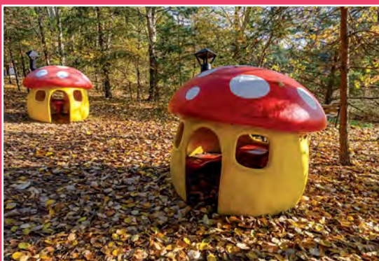
Park Grzybów Leśnych w Piłce Pilzpark in Piłka

roku na festyn zapraszana jest gwiazda imprezy. Podczas festynu promują się zespoły muzyczne i utalentowani wokaliści.