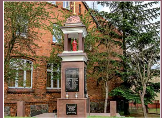
Pamięci poległych mieszkańców Drawska Denkmal der gefallenen Einwohner von Drawsko