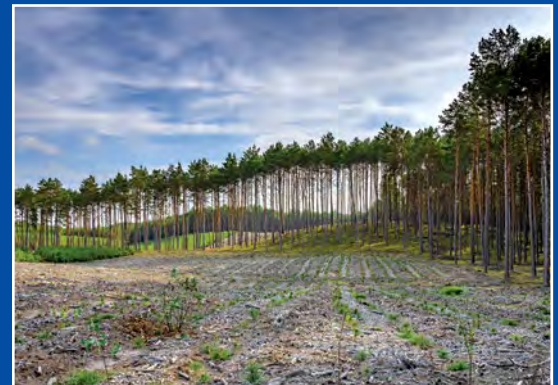
W Puszczy Noteckiej Im Netzer Urwald