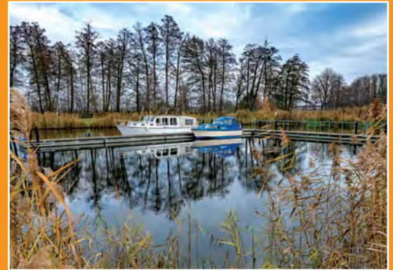
Przystań Yndzel w Drawsku Anlegestelle „Yndzel” in Drawsko

Droga wodna Wisła - Odra projektowana była od połowy XVI wieku. Regulacja Noteci i przystosowanie jej do spławu polskich produktów rolniczych do Szczecina było dyskutowane z Brandenburgią. Po pierwszym rozbiórce polski król pruski Fryderyk II podjął pomysł budowy kanału Brda - Noteć. Miał on łączyć Berlin i Królewiec, był łatwą drogą zaopatrzenia armii pruskiej oraz konkurował z polskim wówczas Gdańskiem. Pierwszy odcinek drogi wodnej o długości 26 km wybudowano w latach 1772 -1774. Ze względu na to, że pierwsza droga wodna była mało sprawna, na przełomie XVIII i XIX wieku przebudowano część śluz na murowane z cegły. Następne ważne przebudowy przeprowadzono w latach 1840-52. Dolną Noteci kanalizowano w latach 1873-82, początkowo realizacja ta była wykonana wadliwie więc od 1891 roku rozpoczęto jej korektę. Wyprostowano wtedy bieg rzeki i wybudowano część śluz w kamieniu i cegle, między innymi śluzę w Drawsku. Kolejne usprawnienia drogi wodnej przeprowadzono na początku XX wieku, wykonano wtedy jazy na odcinku Lipica - Krzyż.