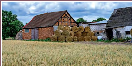
Stara zabudowa w Moczydłach Alte Bebauung in Moczydla