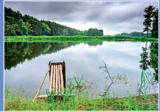
Stawy Zawada Teiche in Zawada

Rybę oczyścić, posolić, pokroić na porcje, obtoczyć w mące i obsmażyć ładnie rumieniąc. Przygotować sos: drobno posiekaną cebulę udusić w masle razem z pieczarkami pokrojonymi w paseczki. Gdy lekko zrumienią się, posypać mąką, rozprowadzić wywarem i zagotować mieszając. Następnie przelać sos do większego płaskiego rondla, doprawić do smaku solą, wlać wino, włożyć rybę oraz obrane i pokrojone na ćwiartki ziemniaki. Przykryć rondel i dusić na średnim ogniu przez 17-20 min.