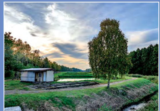
Stawy Zawada Teiche in Zawada