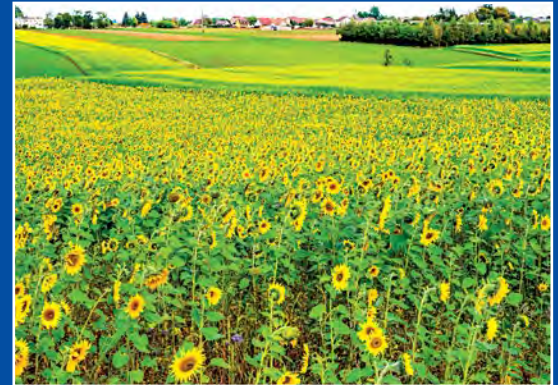
Słonecznikowe pola koło Drawsko Sonnenblumen Felder bei Drawsko