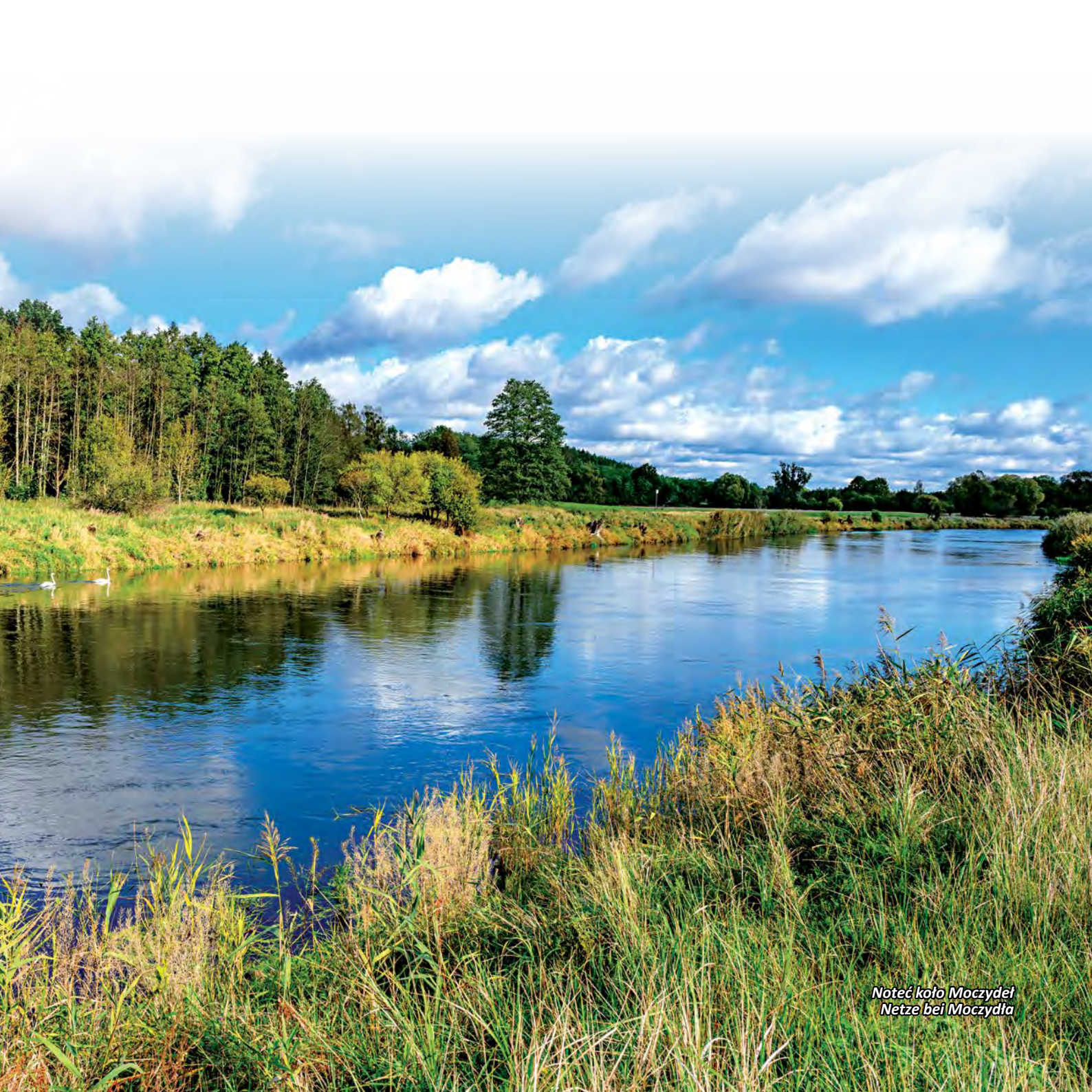
Noteć koło Moczydeł Netze bei Moczydła