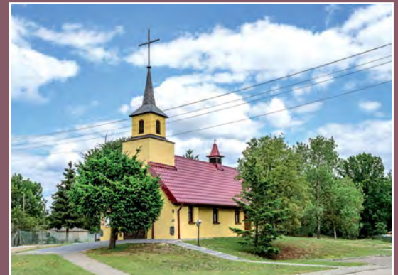
Kościół w Kamienniku Kirche in Kamiennik