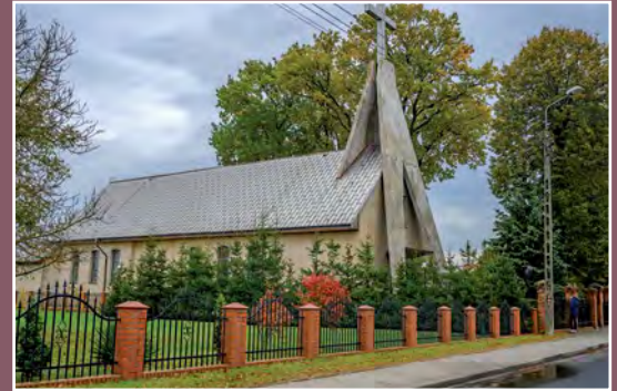
Kościół w Pęcownie Kirche in Pęckowo

W dokumentach w 1565 r. pojawia się wzmianka o pile (tartaku) na rzece Miała należącej do wsi Pęckowo. Tarcie (przetarte drzewa) spuszczano Notecią do Szczecina lub wożono do królewskiej wsi Rataje koło Chodzieży (właścicielem dóbr wieleńskich i Rataj był wówczas Stanisław Górka). Piła mogła przetrzeć tyle tarcic, że starczyło ich na dwie tratwy; na jedną tratwę ładowano 24 kopy tarcic a w Szczecinie 1 kopę sprzedawano za 7 lub 8 złotych. W pobliżu tartaku osiedleni byli zagrodnicy, którzy pilnowali pobliskich stawów.