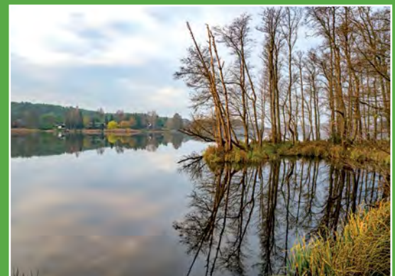
Jezioro Białe Biala - See