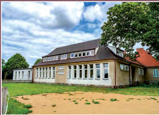
Szkoła w Chełście Schule in Chełst

gatunków: dębów, lip, świerków, jesionów, modrzewia. Na terenie parku znajdują się dworek – dawna nadleśniczówka i budynki gospodarcze. Według innych źródeł dworek pochodzi z 1892 r., pralnia, obecnie budynek mieszkalny, kuchnia folwarczna obecnie budynek mieszkalny, dom robotników folwarcznych - Drawsko Nadleśnictwo 2, obora obecnie budynek gospodarczo – garażowy, budynek gospodarczo – inwentarski mur./drewno, dom służby obecnie budynek gospodarczy