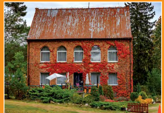
Gospodarstwo agroturystyczne Zieleniec Agrartourismusbauernhof Zieleniec