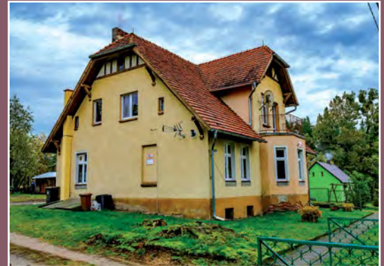
Przedszkole w Piłce Kindergarten in Piłka