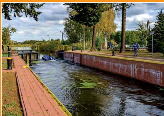
Śluza w Drawskim Młynie Schleuse in Drawski Młyn

Po pierwszej wojnie światowej kanał bydgoski znalazł się w Polsce, a reszta drogi wodnej Wisła - Odra została wzdłuż osi przecięta granicą państwową, co osłabiło jej znaczenie. Pomimo to uznano ją za najskuteczniejszą i najpiękniejszą sztuczną drogę Rzeczypospolitej. Drogę tę obsługiwały dwie załogi - po południowej stronie polską, po północnej niemiecką.