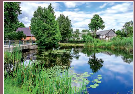
Staw młyński w Kamienniku Mühlenteich in Kamiennik