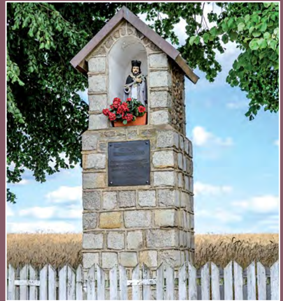
Kapliczka św. Wawrzyńca w Pećkowie Kapelle des heiligen Laurentius in Pećkowo