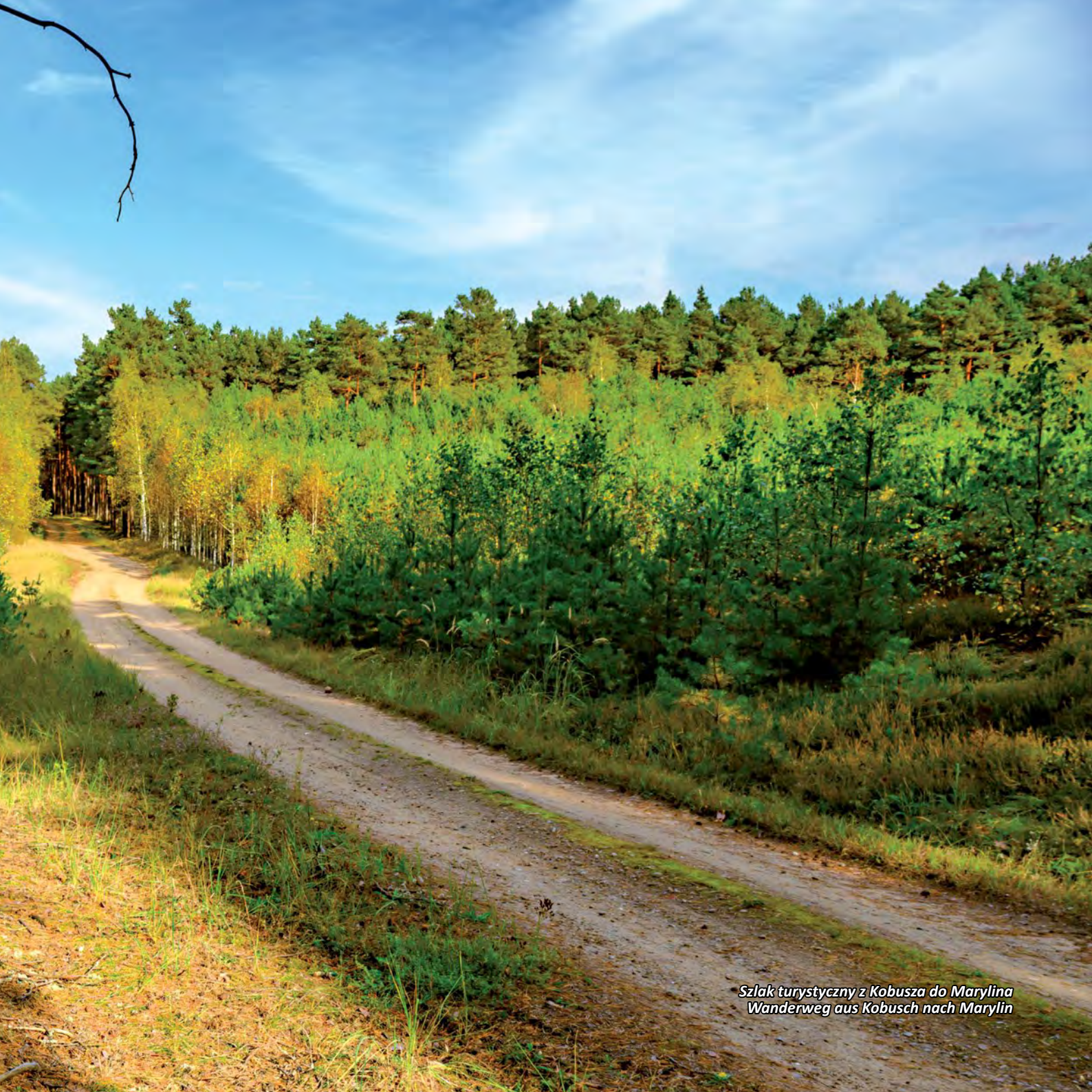
Szlak turystyczny z Kobusza do Marylina Wanderweg aus Kobusch nach Marylin