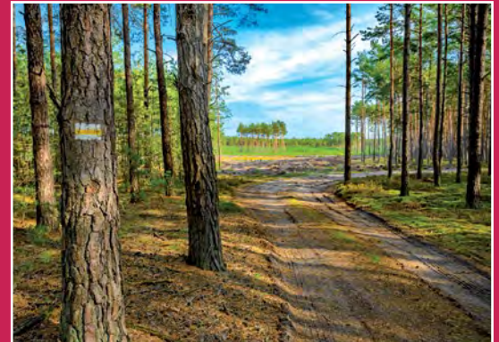
Żółty szlak turystyczny przez Puszcze Notecką Gelber Wanderweg in Netzer Urwald