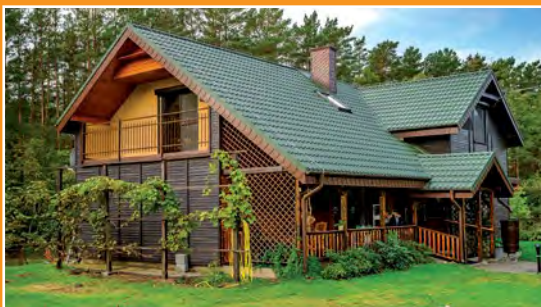
Gospodarstwo agroturystyczne Karpniki Agrartourismusbauernhof Karpniki