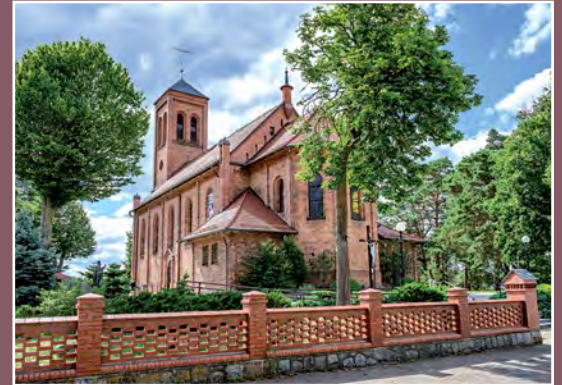
Kościół w Piłce Kirche in Piłka

Oczyszczonego i sprawnego karpia umyć, pokroić na dzwonka, posolić, odstawić na pół godziny w chłodne miejsce. Śliwki opłukać, wydrylować i zmiksować z winem i przyprawami. Rybę obtoczyć w mące, zrumienić na oliwie z obu stron. Ułożyć w żaroodpornym naczyniu, polać sosem i zapiec. Podawać z ziemniakami z wody i surówką z cykorii.