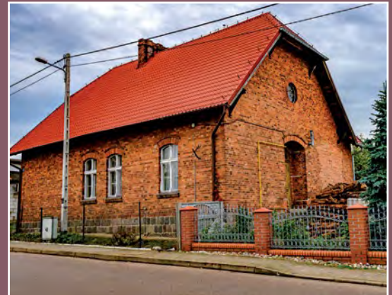
Dawna kaplica ewangelicka w Piłce Ehemalige evangelische Kapelle in Piłka