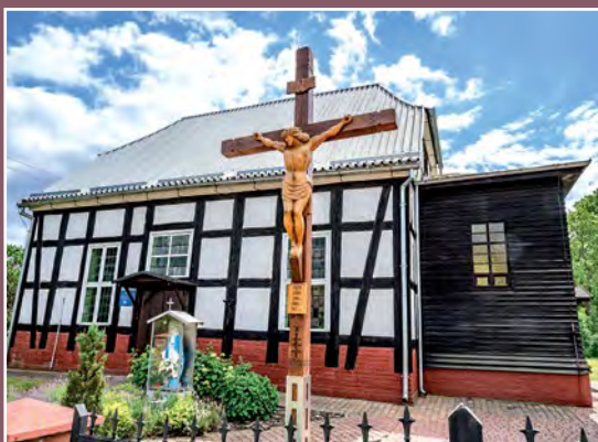
Kościół w Chełście Kirche in Chełst

Szczególnie bujny rozwój osadnictwa i powstawania wsi nastąpił od XV – XVI w. Najstarszą wsią na terenie gminy jest Drawsko wzmiankowane w 1298 roku; kolejne wsie, jak Drawski Młyn, Pęckowo i Chełst powstały w XVI wieku, osadę Piłka z młynem założono na początku XVII wieku, Zieleniec (aktualnie to część wsi Kwiejce Nowe); Kwiejce Nowe oraz prawdopodobnie Kamiennik, Kawczyn i Pełcza pochodzą z XVIII wieku.