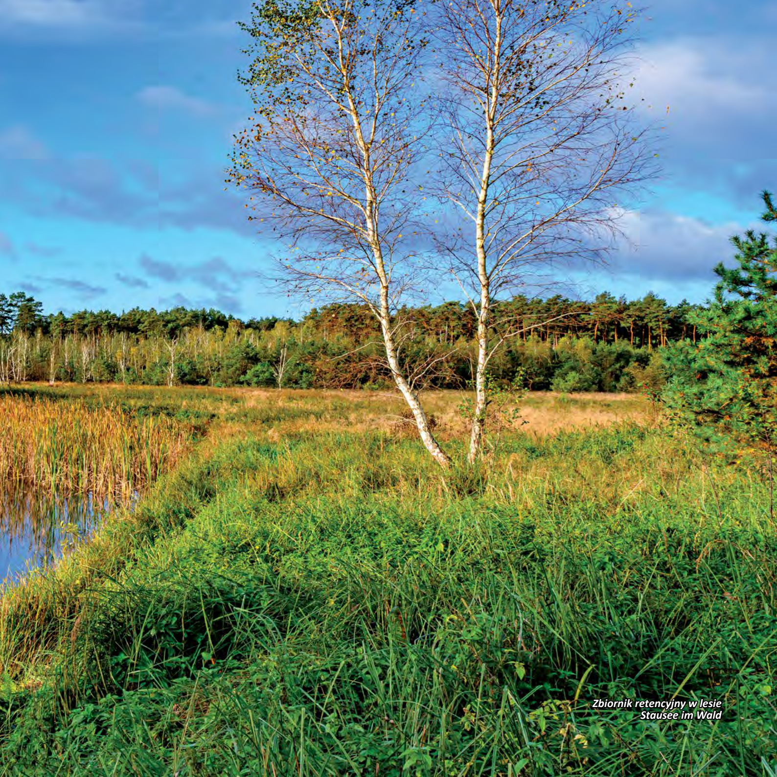
Zbiornik retencyjny w lesie Stausee im Wald