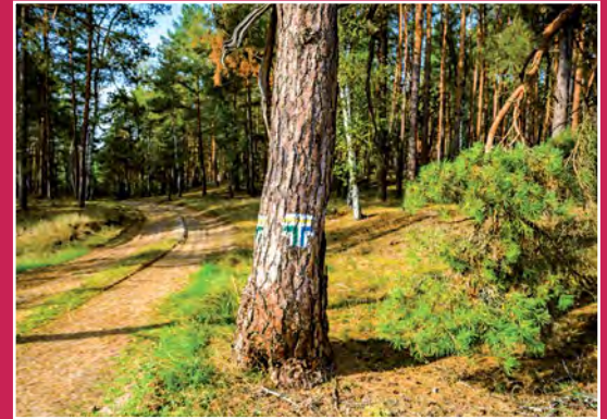
Skrzyżowanie szlaków turystycznych w Kobuszu Knotenpunkt der Wanderwege in Kobusz

Odcinek Piłka – Marylin ma 4,5 km długości. Jest ciekawy ze względu na przebieg szlaku wzdłuż Miały, po drodze przejdziemy po spróchniałym mostku na drugą stronę rzeki, minimy samotne gospodarstwo po lewej stronie a następnie wysokim brzegiem rzeki będziemy podążać do Marylina. Przed Marylinem z wysokiej skarpy wypływają malownicze źródła dopływów Miały.