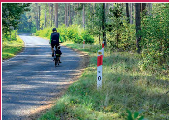
Na szlaku rowerowym Auf dem Radweg