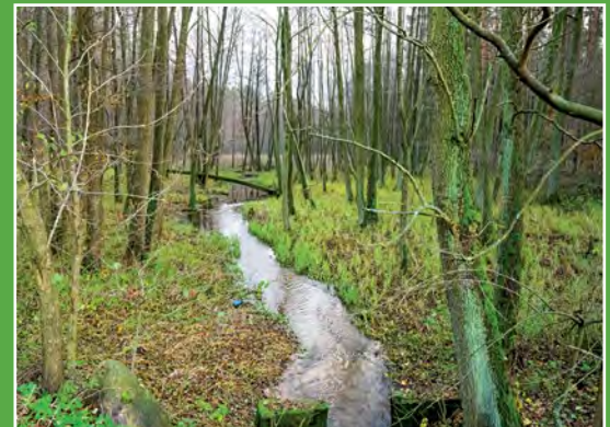
Miały w górnym biegu Oberfluss des Miala - Fliesses