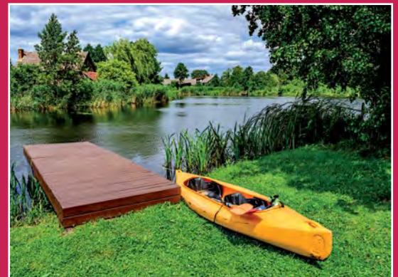
Przystań kajakowa w Kamienniku Anlegestelle in Kamiennik