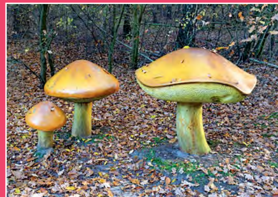
Park Grzybów Leśnych w Piłce Pilzpark in Piłka