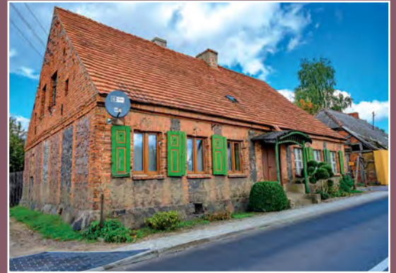
Stary dom w Chełście Altes Haus in Chełst