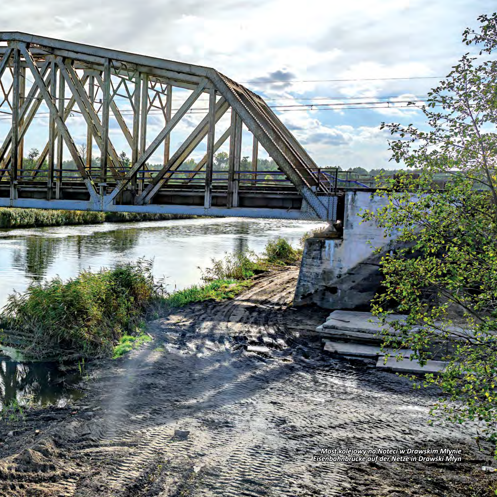
Most kolejowy na Noteci w Drawskim Młynie Eisenbahnbrücke auf der Netze in Drawski Młyn