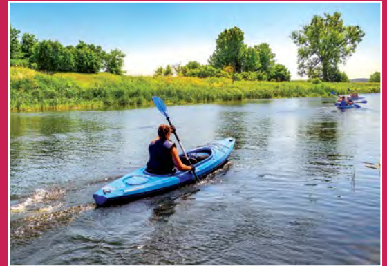
Kajakiem po Noteci Mit dem Kajak auf der Netze