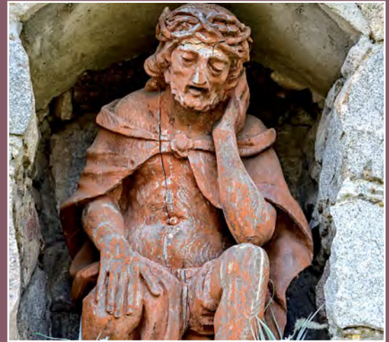
Kapliczka na cmentarzu w Drawsku Kapelle auf dem Friedhof in Drawsko