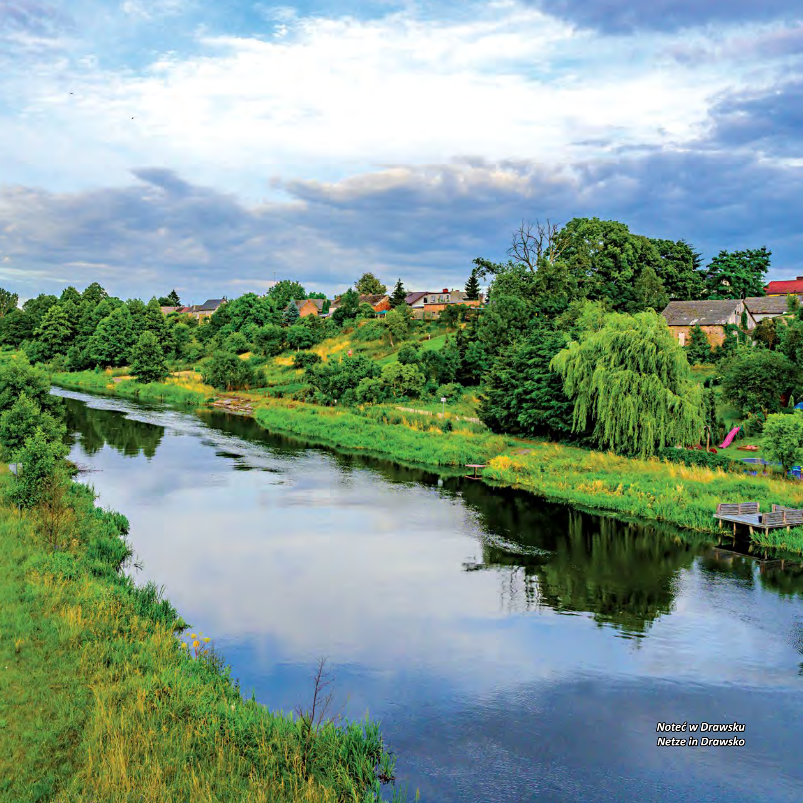
Noteć w Drawsku Netze in Drawsko