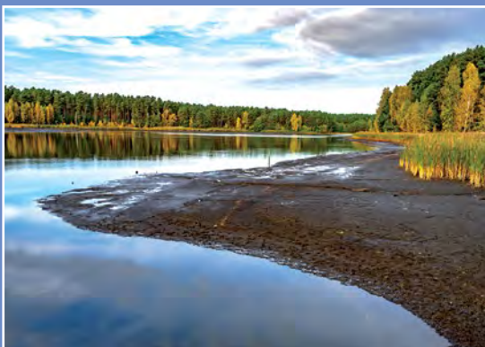
Stawy gospodarstwa Kwiejce - Karpniki Teiche des Fischereibetriebes Kwiejce - Karpniki