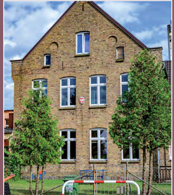
Szkoła w Pećkowie Schule in Pećkowo