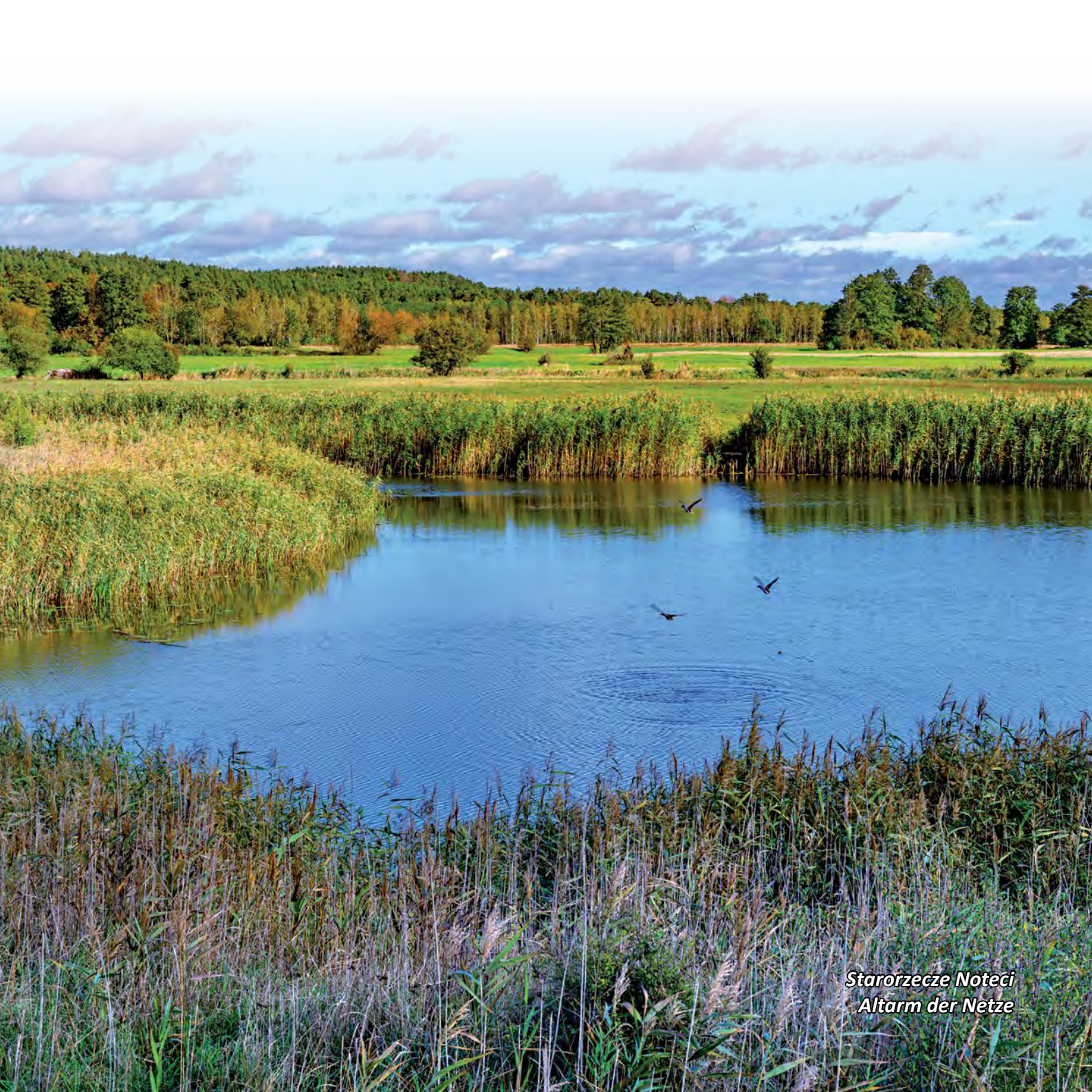
Starorzecze Noteci Altarm der Netze