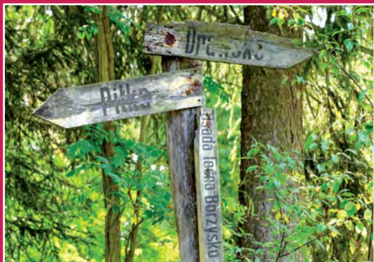
Leśne drogowskazy Wegweiser im Wald