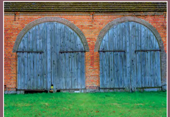
Stodoła w Moczydłach Scheune in Moczydła