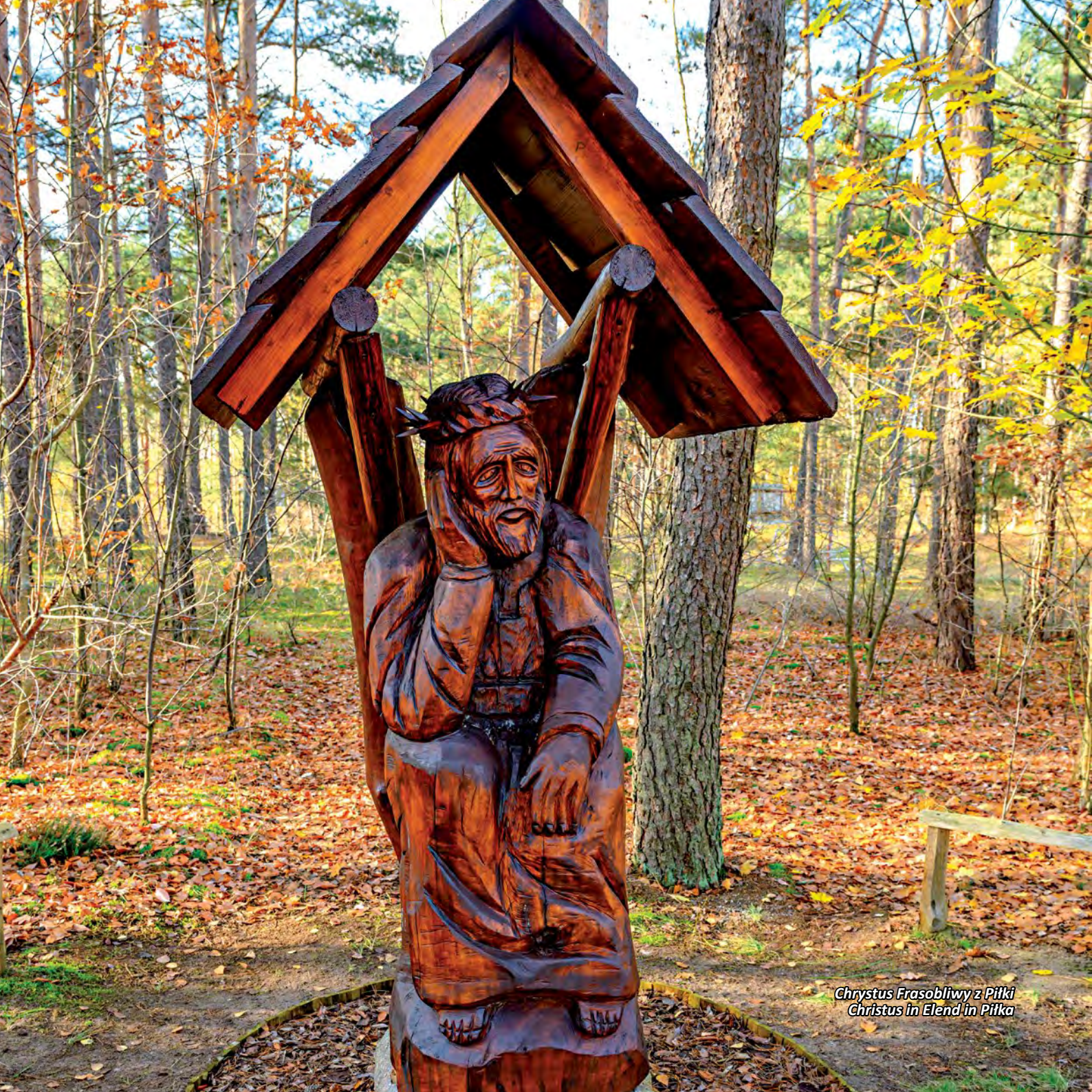
Chrystus Frasobliwy z Pilki Christus in Elend in Pilka