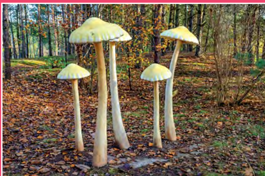
Park Grzybów Leśnych w Piłce Pilzpark in Piłka