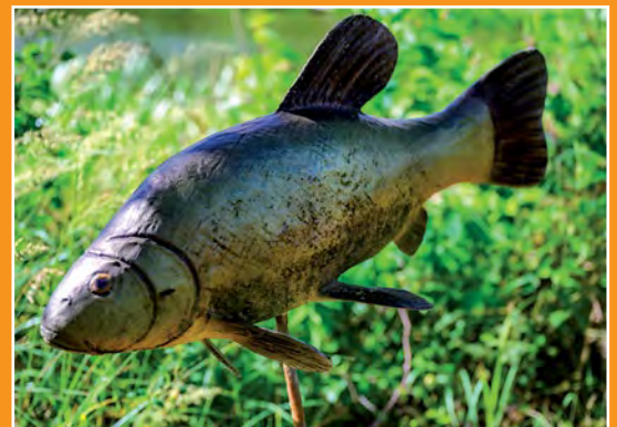
Maryliński Świat Ryb Fische Welt in Marylin