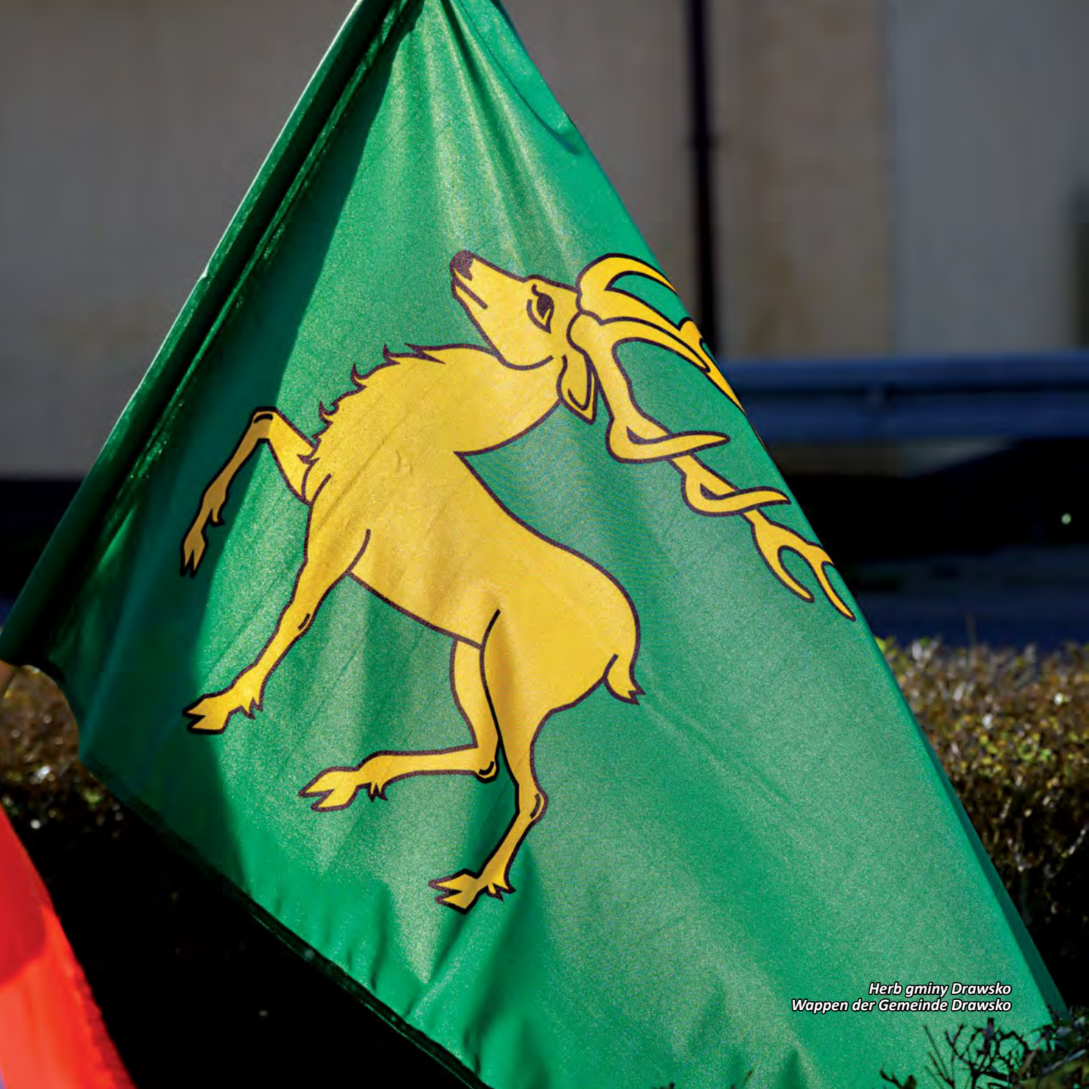
Herb gminy Drawsko Wappen der Gemeinde Drawsko