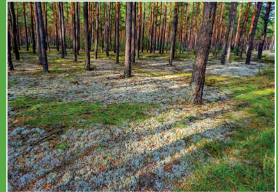
Uboższe lasy Puszczy Noteckiej Arme Wälder im Netzer Urwald

Obszar Natura 2000 „Puszcza Notecka” PLB300015. Obszar stanowi zwarty, jednolity kompleks leśny w międzyrzeczu Noteci i Warty, będącym częścią pradoliny Eberswaldsko-Toruńskiej. Jest to najwięk-