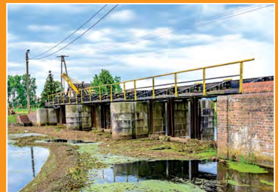
Stopień piętrzący Rosko Stauwehr in Rosko