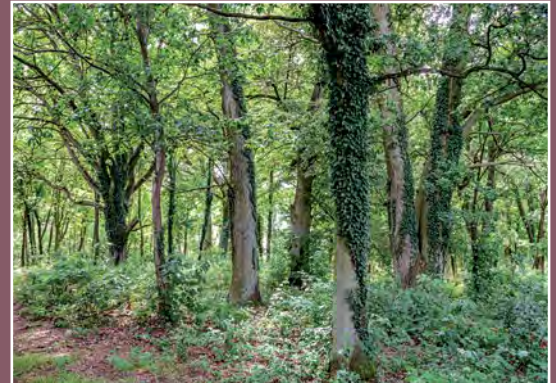
Dawny cmentarz ewangelicki w Kawczynie Der ehemalige evangelische Friedhof in Kawczyn

Początkowo była to osada założona w XVI w. nad Jeziorem Kwiejce. Pierwsza wzmianka o tej osadzie pojawia się w 1592 r. Jezioro Kwiejce znane było już od 1424 r. (pod nazwą Queske ) w 1527 r. Queczcze , w 1564 r. Kwiejcza . Koło jeziora biegła granica z Nową Marchią. Jezioro o dwóch toniach niewodowych należało do wsi Pęcokowo.