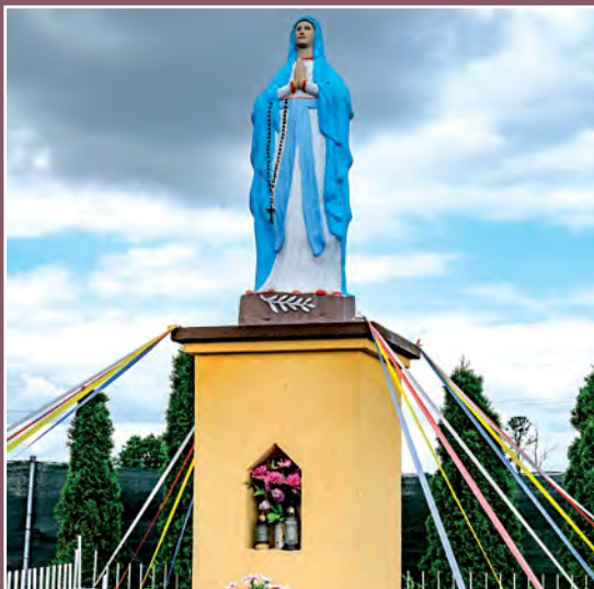
Kapliczka w Moczydłach Kapelle in Moczydla