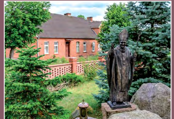
Plebania Pfarrhaus in Piłka