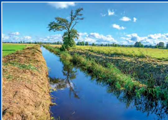
Kanał Chełst Chełst - Kanal