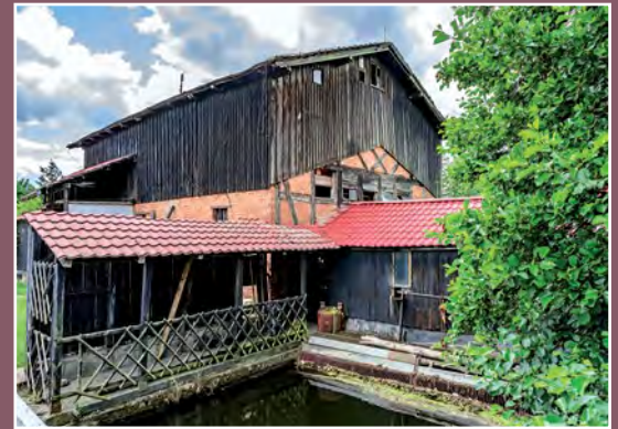
Młyn w Kamienniku Mühle in Kamiennik