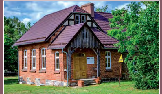
Dawna szkoła w Marylinie Ehemalige Schule in Marylin