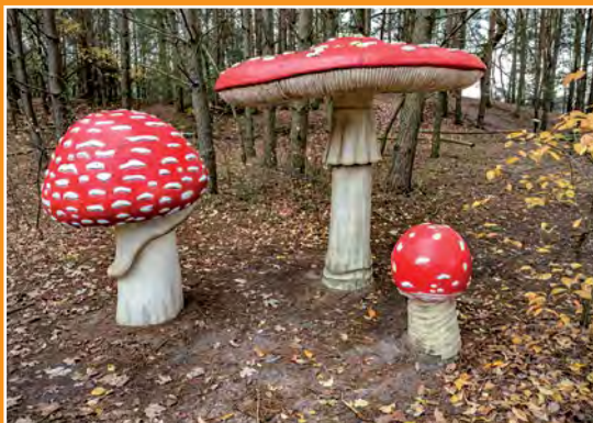
Park Grzybów Leśnych Piłzpark