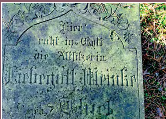
Nagrobek z cmentarza ewangelickiego w Piłce Grabstein auf dem evangelischen Friedhof in Piłka

W XIX w. wieś miała 97 domów, 745 mieszkańców (529 katolików, 216 protestantów). Pierwszy kościół – drewniany wybudowali Piotr Sapieha i jego żona Joanna z Sułkowskich. W 1767 r. Sapieha sprowadził również nowych osadników, co przyczyniło się do dużego rozwoju wsi. Pierwszy kościół spłonął a kolejny wybudowano w 1868 r.