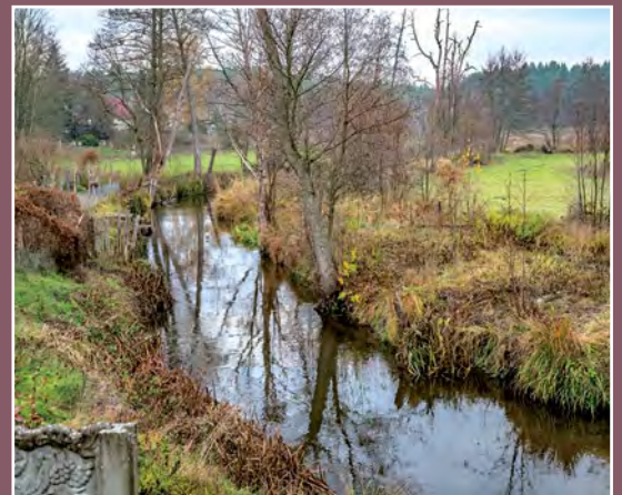
Miała w Marylinie Miale - Fliess in Marylin