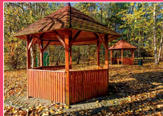
Park Grzybów Leśnych w Piłce Pilzpark in Piłka