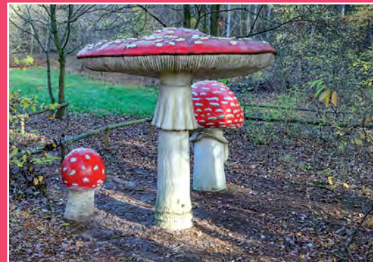
Park Grzybów Leśnych w Piłce Pilzpark in Piłka