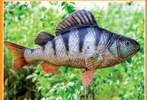
Maryliński Świat Ryb Fische Welt in Marylin