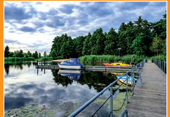
Przystań Yndzel w Drawsku Anlegestelle „Yndzel” in Drawsko