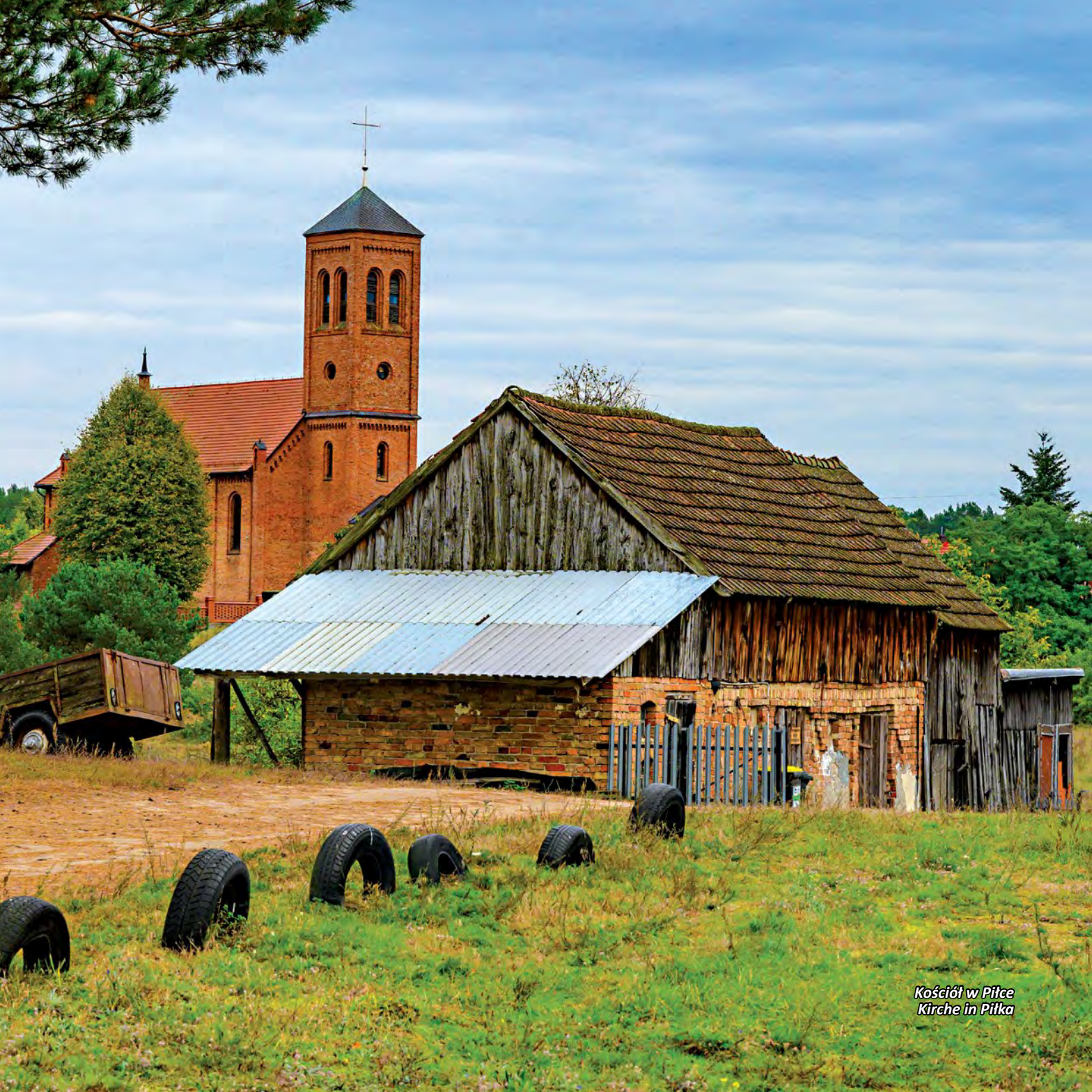
Kościół w Piłce Kirche in Piłka