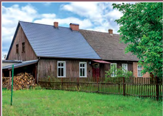
Stary dom w Kwiejcach Starych Altes Haus in Kwiejce Stare