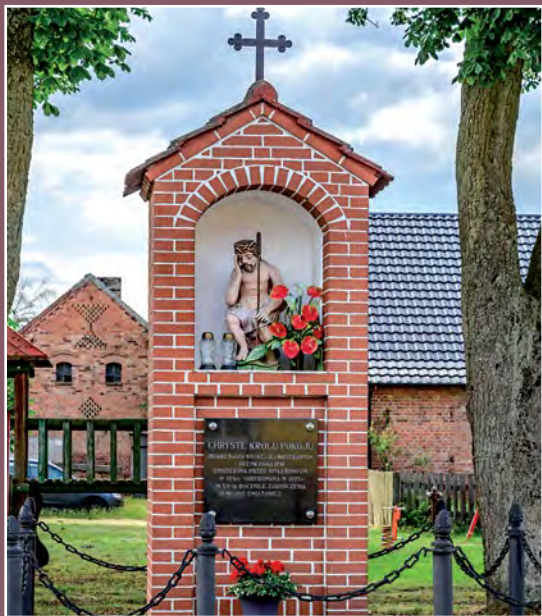
Chrystus Frasobliwy z Pęckowa Christus in Elend aus Pęckowo