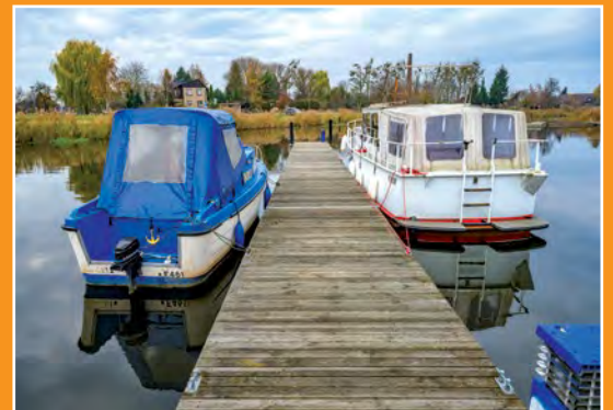
Przystań Yndzel w Drawsku Anlegestelle „Yndzel” in Drawsko