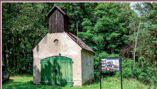
Dawna remiza w Kawczynie Ehemalige Feuerwache in Kawczyn