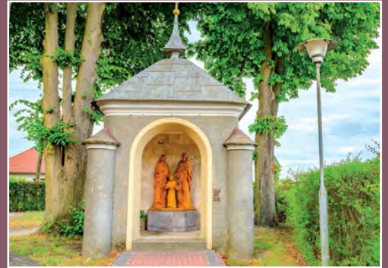
Kaplica w Drawsku Kapelle in Drawsko