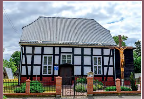
Dawny kościół ewangelicki w Chełście Ehemalige evangelische Kirche in Chełst