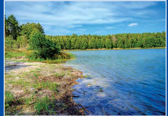
Jezioro Długie w Borowym Młynie Lange See in Borowy Młyn

Przez gminę Drawsko płyną cztery rzeki: Noteć, Miała, Rudawa oraz Człapia.