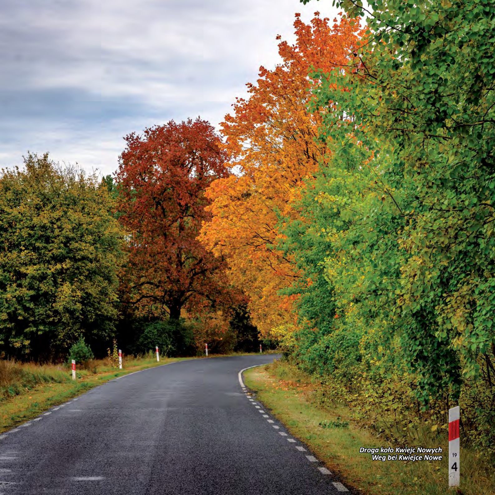
Droga koło Kwiejc Nowych Weg bei Kwiejce Nowe