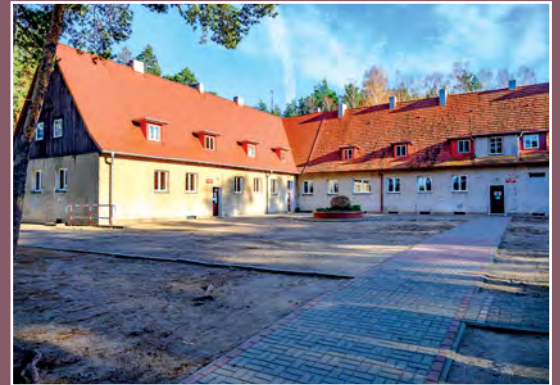
Dawna strażnica graniczna w Chełście Ehemaliges Haus der Grenzwächter in Chełst