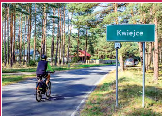
Na szlaku rowerowym przed Kwiejcami Auf dem Radweg vor Kwiejce

Kolejny szlak dalekobieżny to szlak niebieski dalekobieżny PTTK o przebiegu ogólnym Ujście – Czarnków – Sieraków – Międzychód – Pszczew – Zbąszyń – Kaszczor – Leszno – Góra – Wąsosz , długości całkowitej 365,2 km.